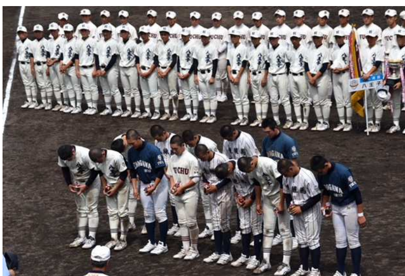
MVP、優秀選手賞及びベストナインに選出された各選手